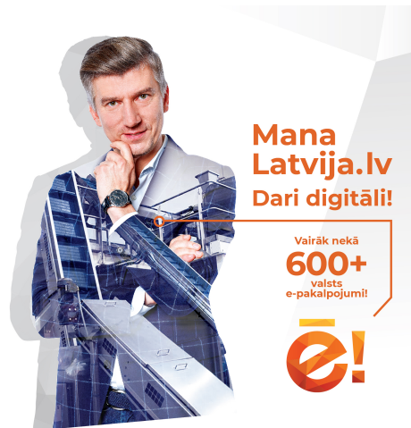
Es, Enno Ence*,